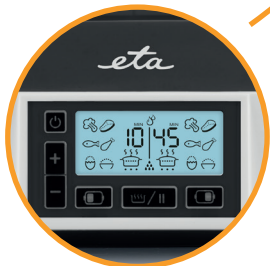
Timer bis 99 Minuten